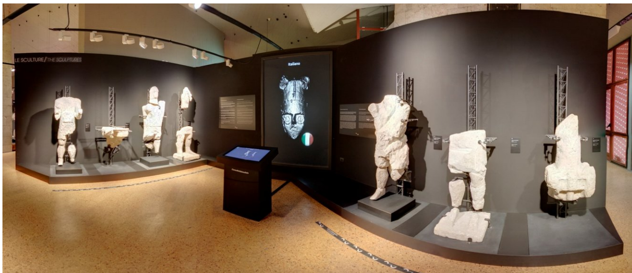
Figura 1. Digital Mont' Prama: installazione presso il museo archeologico di Cagliari.

Le sculture nuragiche di Mont'e Prama sono la più grande novità dell'archeologia sarda degli ultimi decenni. Ritrovate in una miriade di frammenti nell'area della singolare necropoli di Mont'e Prama, nel Sinis di Cabras, queste grandi sculture calcaree riproducono gli schemi figurativi e lo stile dei più elaborati bronzetti nuragici dell'età del Ferro e sono di enorme importanza storica e artistica. Anche se la loro precisa datazione non è ancora certa, alcune tra le più accreditate ipotesi potrebbero farne fra le più antiche sculture a tutto tondo del bacino mediterraneo (Usai, 2014). Le sculture ricomposte da un accurato progetto di restauro sono finora 38, suddivise in 5 arcieri, 4 guerrieri, 16 pugilatori e 13 modelli di nuraghe. Le dimensioni delle sculture variano dal metro circa per i nuraghi ai 2.5m per le sculture antropomorfe.