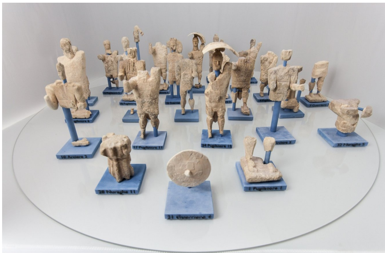
Figura 7 Riproduzione materica. Nuovi metodi di miglioramento delle stampe 3D, descritti in (Cignoni,2008) e (Cignoni, 2010) sono stati ideati ed utilizzati per ottenere delle repliche fisiche con dettagli riconoscibili anche a piccola scala. La figura mostra riproduzioni in scala 1:10.

sculture in pietra, le loro proprietà ottiche e fisiche limitano la presenza di dettagli fini nelle riproduzioni a piccole scale. Abbiamo pertanto sviluppato dei metodi innovativi che migliorano la riproduzione di colore e forma delle stampanti 3D, per migliorare la percezione dei dettagli attraverso ombreggiature (Cignoni, 2008) e per conservare dettagli fini in repliche in scala (Cignoni, 2010). In Figura 7 vengono mostrati alcuni modelli in gesso alla scala 1:10. La stampante utilizzata è una ZCorp-Z450.