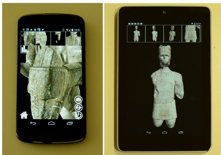
Figura 6. Esplorazione interattiva dei modelli digitali su dispositivi mobili: un'interfaccia semplificata (Balsa, 2014) ed un'architettura client-server (Balsa, 2013) consentono di visualizzare i modelli digitali ad alta risoluzione su smartphone e tablet di nuova generazione.

La visualizzazione delle sculture di Mont'e Prama su piattaforme mobili avviene riducendo la banda e la memoria locale necessarie attraverso un metodo di compressione che permette la visualizzazione diretta del dato compresso e migliorando i meccanismi di richiesta asincrona durante la visualizzazione per evitare che l'applicazione si blocchi quando i dati richiesti non sono ancora disponibili.