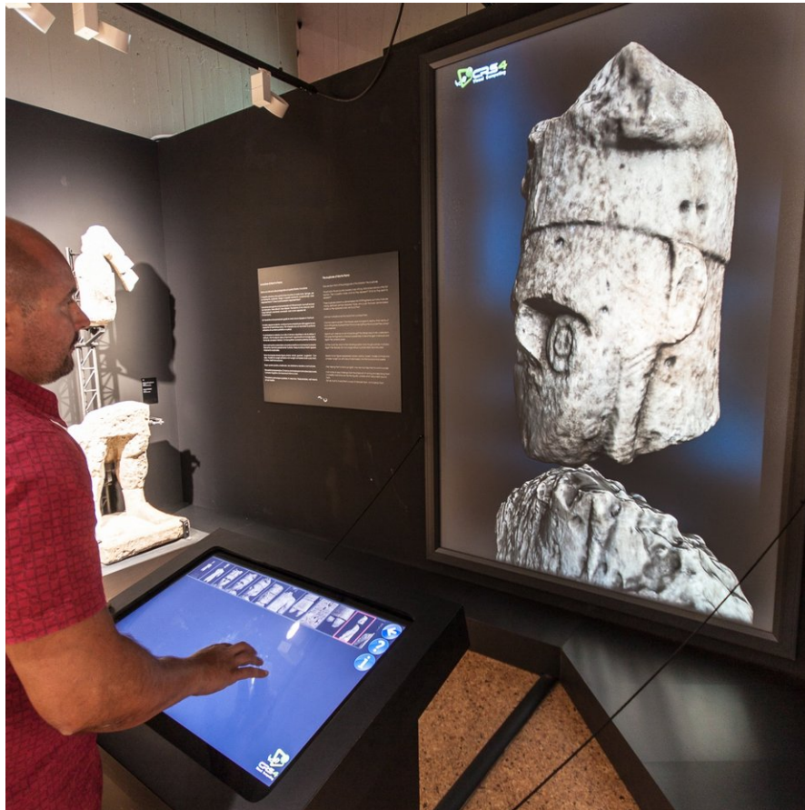
Figura 5 Sistema di esplorazione interattiva dei modelli ad alta risoluzione per installazioni museali: un setup innovativo, descritto in (Marton, 2014), e basato su tecnologie di visualizzazione multirisoluzione (Cignoni 2004) ed interfacce di navigazione interattiva semplificate (Balsa, 2014), consente ad i visitatori di apprezzare le ricostruzioni virtuali delle sculture fino al dettaglio più fine. La foto mostra l'istallazione al museo archeologico di Cagliari.

distanza di comfort al dettaglio desiderato. In questo design lo schermo tattile non fornisce alcuna informazione visiva durante l'esplorazione dei modelli, per incoraggiare gli utenti a focalizzare la loro attenzione soltanto sulle sculture proiettate.