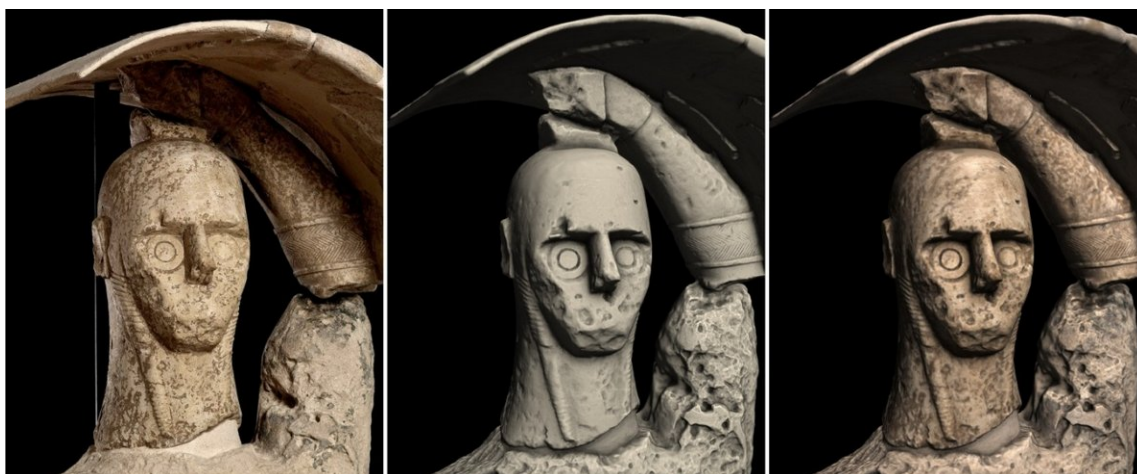
Figura 4. Ricostruzione virtuale: confronto di una foto originale (immagine a sinistra) con la visualizzazione del modello 3D illuminato con una luce virtuale posizionata in modo da enfatizzare i dettagli geometrici. La foto al centro è senza colore, mentre la foto a destra utilizza la riflettanza diffusa misurata.

I modelli 3D, liberi da dati estranei, sono poi stati creati utilizzando le nostre pipeline per la ricostruzione 3D e la mappatura di colore (Bettio, 2014). Le deviazioni di colore introdotte dalla luce del flash sono state corrette durante la fase di proiezione e fusione dei colori grazie alla conoscenza della posizione relativa della sorgente d'illuminazione rispetto a ogni punto illuminato. Invertendo un modello d'illuminazione basato su un'approssimazione Lambertiana della superficie, il colore apparente è stato trasformato in un'approssimazione dell'albedo.